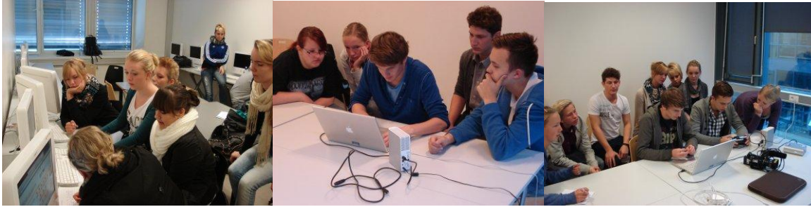
Fotos Nr. 6, 7, 8: Elvebakken und KiWi- SchülerInnen beim Filmschneiden und abschließenden Diskussionen.