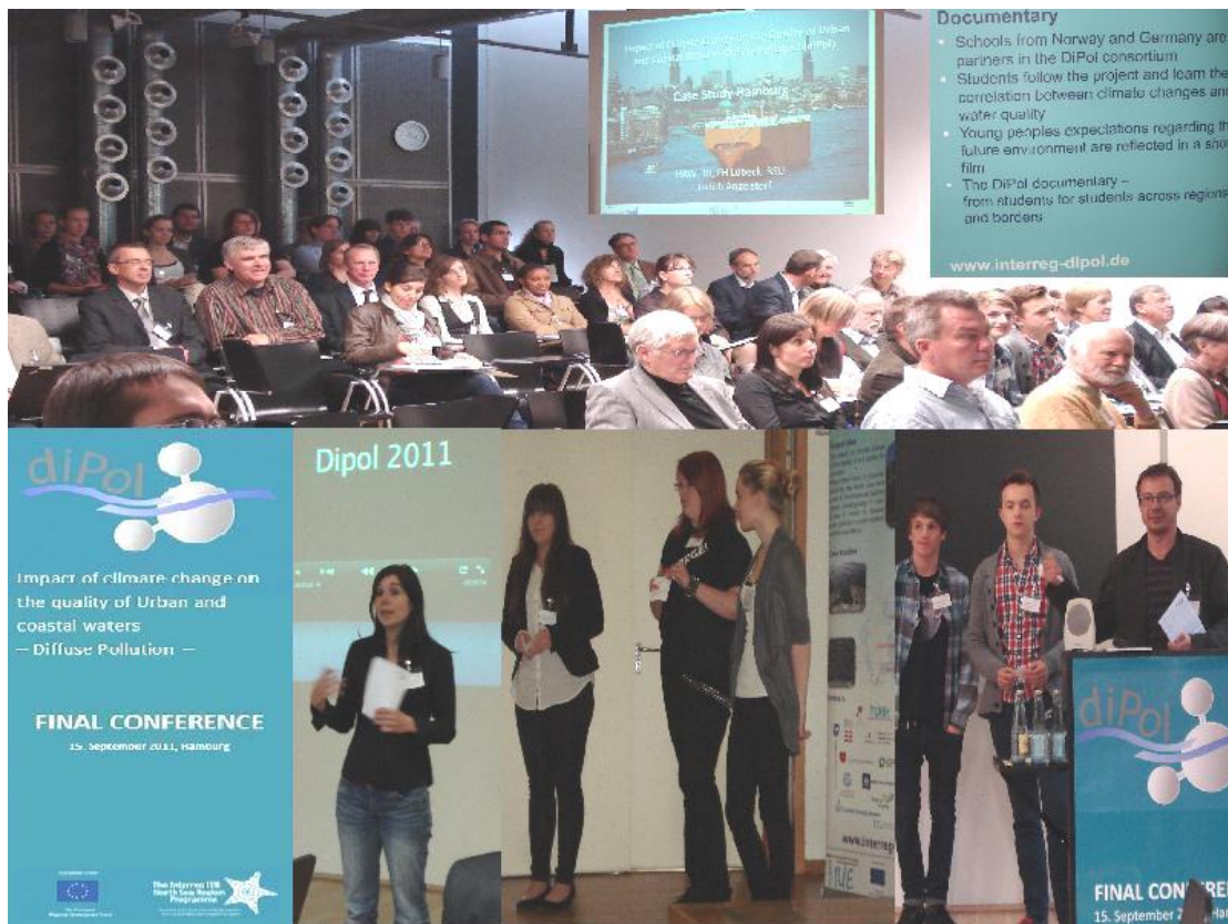
Foto oben: SchülerInnen und LehrerInnen aus Hamburg und Oslo auf der DiPol- Konferenz